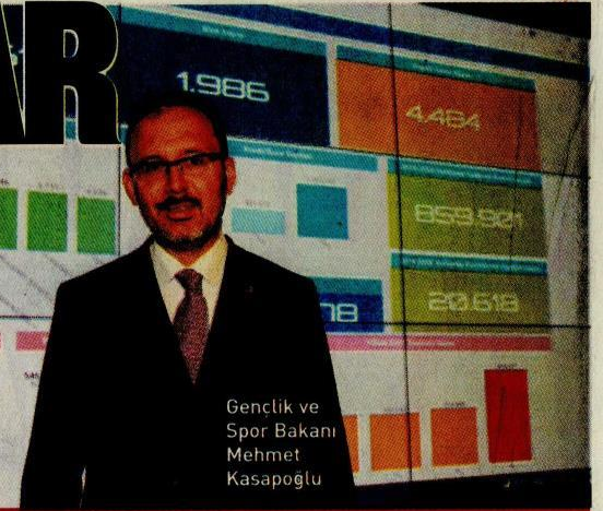
Gençlik ve Spor Bakanı Mehmet Kasapoğlu